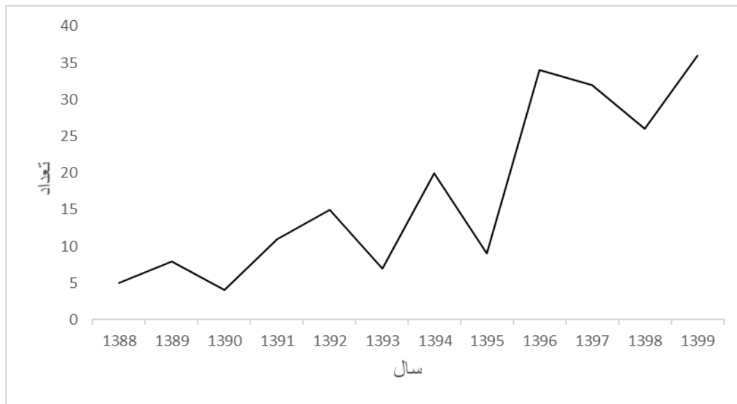
نمودار ۱- تعیین سری زمانی تعداد فارغ التحصیلان در رشته بهداشت و ایمنی مواد غذایی طی سالهای ۱۳۸۸-۱۳۹۹