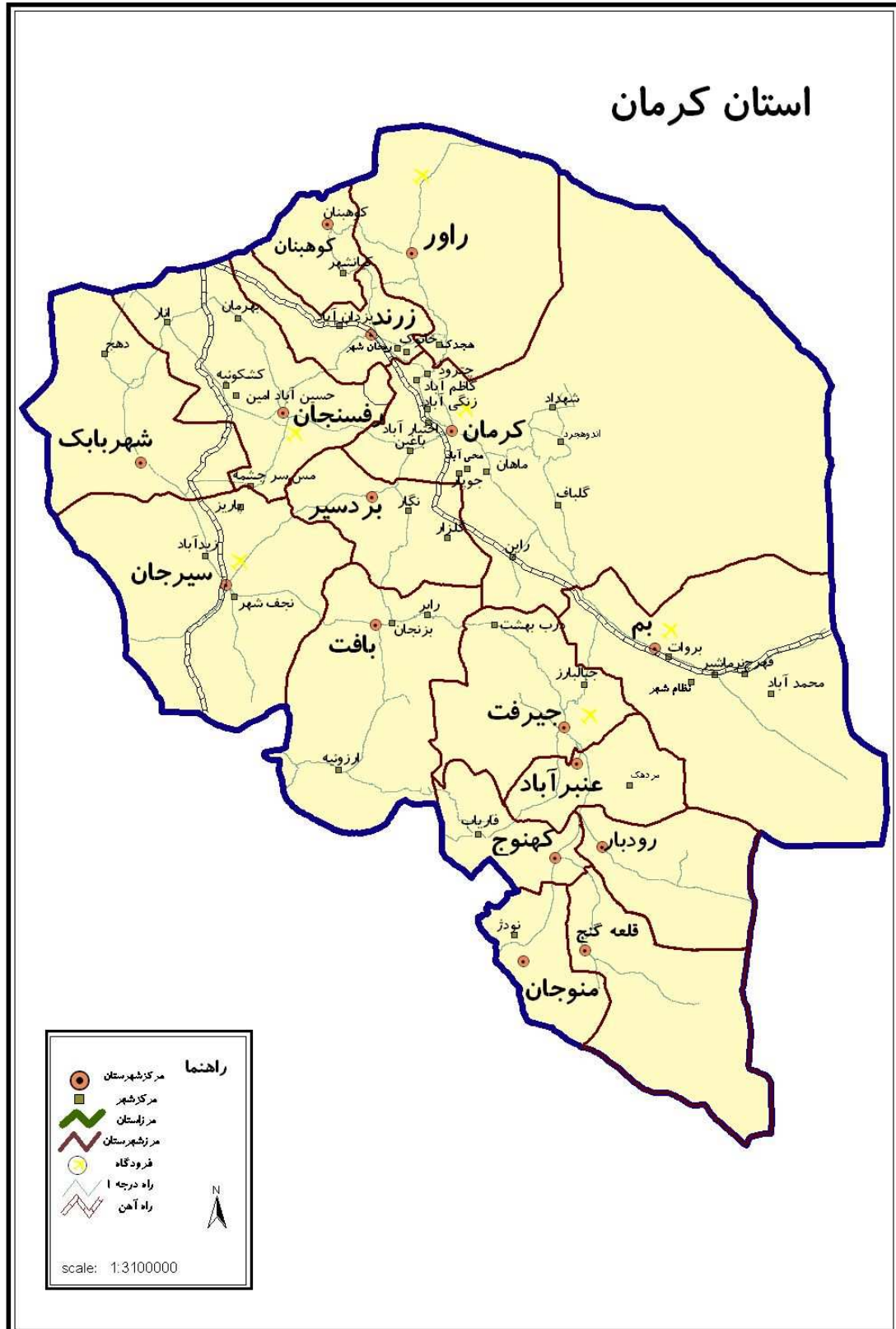
نقشه ۱- استان کرمان و موقعیت جغرافیایی شهرستان های مختلف آن