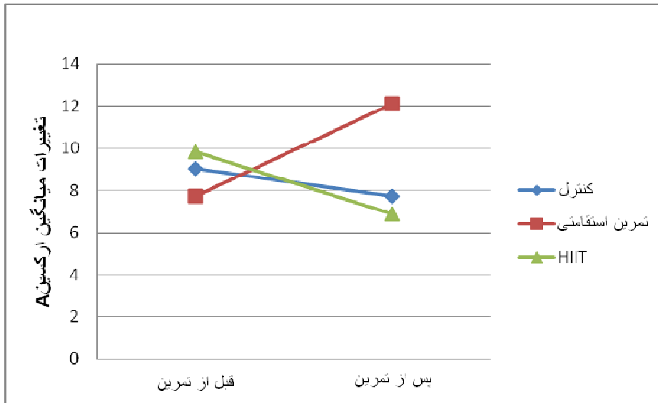
شکل ۲- نمودار تغییرات میانگین سطوح پلاسمایی آرسکین A پس از هشت هفته تمرین استقامتی و HIIT در پسران نوجوان چاق