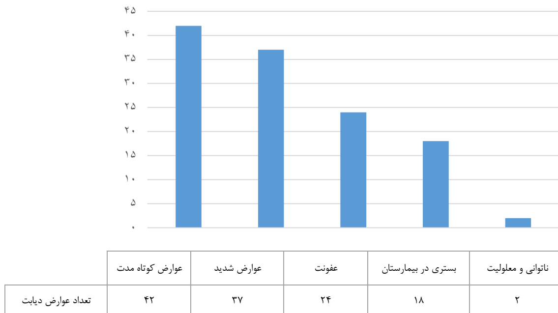
نمودار ۲- فراوانی عوارض بیماری در بیماران شرکت کننده در مطالعه شیوع: بررسی وضعیت پیشگیری و کنترل بیماری دیابت نوع ۲ در جمعیت ساکن شهرستان بوئین زهرا بر اساس اهداف و استراتژی های برنامه کشوری