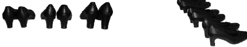
شکل ۱- نماهای مختلف کفش های آزمون