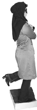
شکل ۳ = آزمون ثبات ایستا