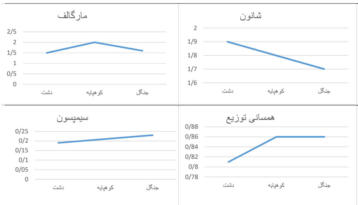
نمودار ۱- داده های حاصل از محاسبات غنای گونه ای (مارگالف) و محاسبات تنوع زیستی گونه ای (شانون-وینر، سیمپسون و همسانی توزیع) جامعه کنه های سخت بر اساس مناطق جغرافیایی، شهرستان مراوه تپه، استان گلستان، ۱۳۹۵