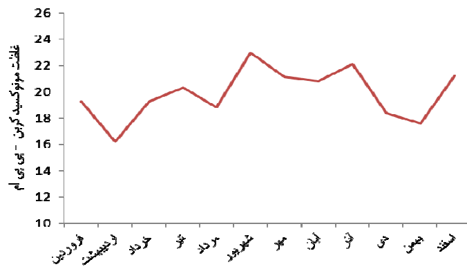
نمودار ۱- مواجهه با مونوکسیدکربن در ماه های مختلف سال در رانندگان تاکسی شهر تهران