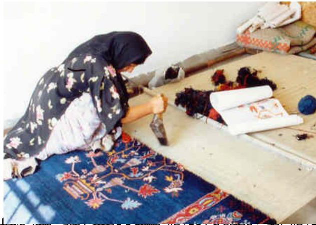
شکل ۲- قالیبافی بر روی الوار اصلی. بافنده بر روی الوار نشسته و وضعیت بدنی بسیار نامناسب و آسیب زا به خود گرفته است.