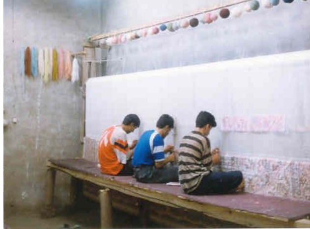
شکل ۱- سه بافنده به صورت چهارزانو بر روی تخته الوار که نقش نشستگاه را دارد نشسته‌اند و مشغول انجام عملیات بافت قالی هستند.