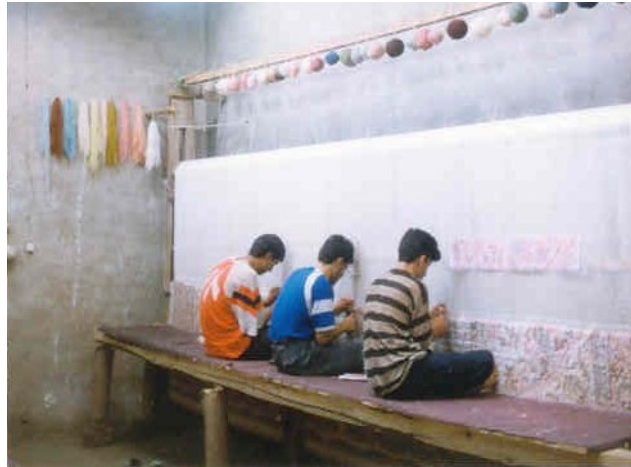
شکل ۱- سه بافنده به صورت چهارزانو بر روی تخته الوار که نقش نشستگاه را دارد نشسته‌اند و مشغول انجام عملیات بافت قالی هستند.