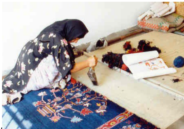
شکل ۲- قالیبافی بر روی الوار اصلی. بافنده بر روی الوار نشسته و رعایت بهای بسیار سبک و آسیب زا به خود گرفته است.