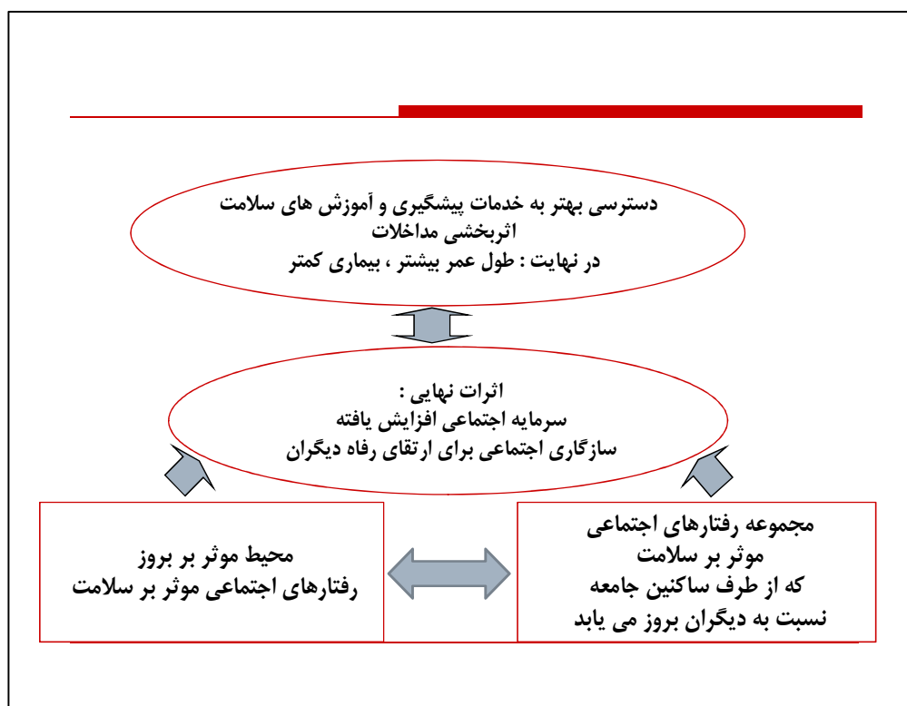
شکل ۲: الگوی مفهومی سلامت اجتماعی