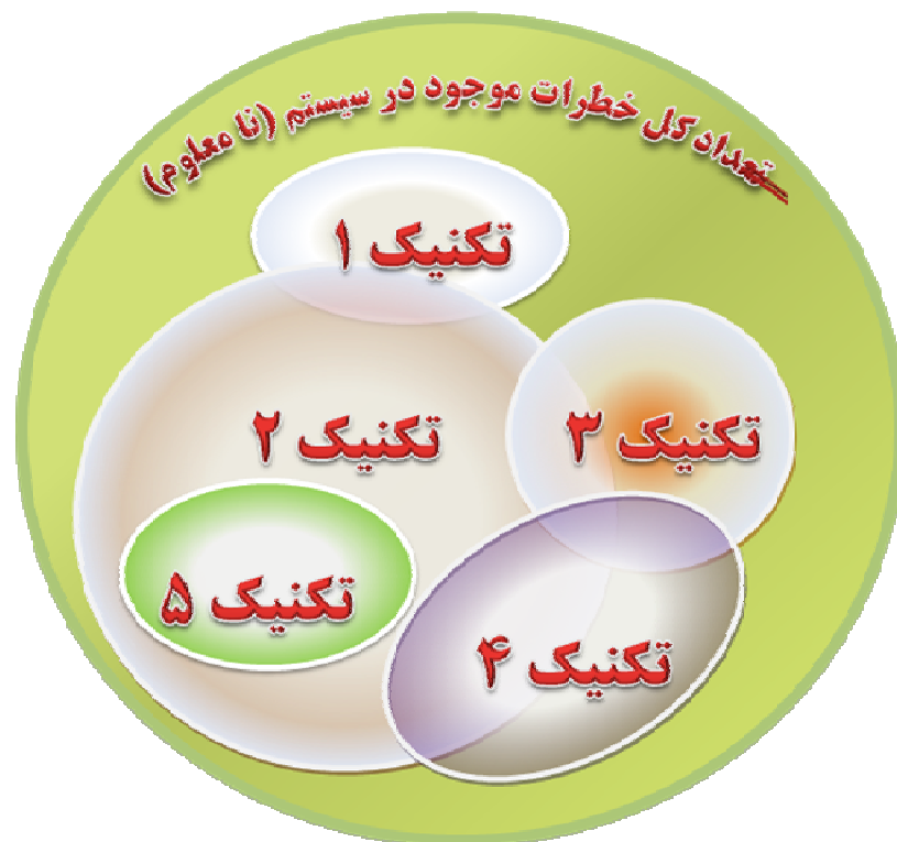
شکل ۱- محدوده کل خطرهای موجود و خطرهای شناسایی شده توسط روش های مختلف (چارچوب فکری شناسایی خطر (Suokas 1989))